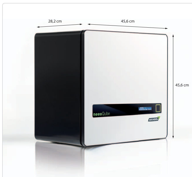
* Gemäß unseren Garantiebedingungen, ** Bei 80 % DoD und 1C